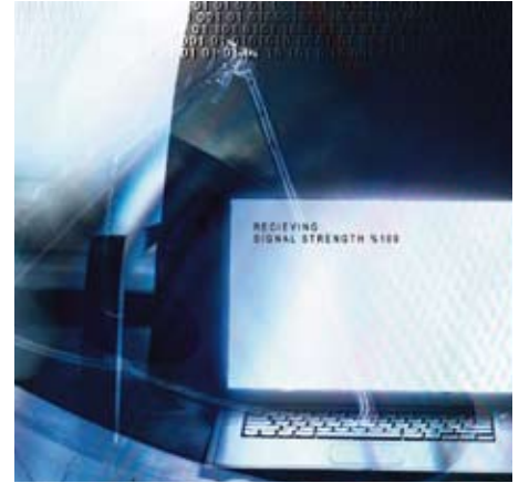
ischen Hubs zu bilden, in dem die Rolle von Quadrante Servizi, in Bezug auf

"With Quadrante Servizi, which has renewed the positions of its own top managers, we are pushing ahead with a project of fundamental importance for the Consorzio ZAI, on the basis of which, with Rete Ferroviaria Italiana and Quadrante Europa Terminal Gate, we will assess the way to create a great European hub in the future where the role of Quadrante Servizi, in terms of rail goods movement, will be even more powerful and strategic. I can also say that we are evaluating the idea of strongly promoting Eurinfra in collaboration with the Council and the Chamber of Commerce. The aim is